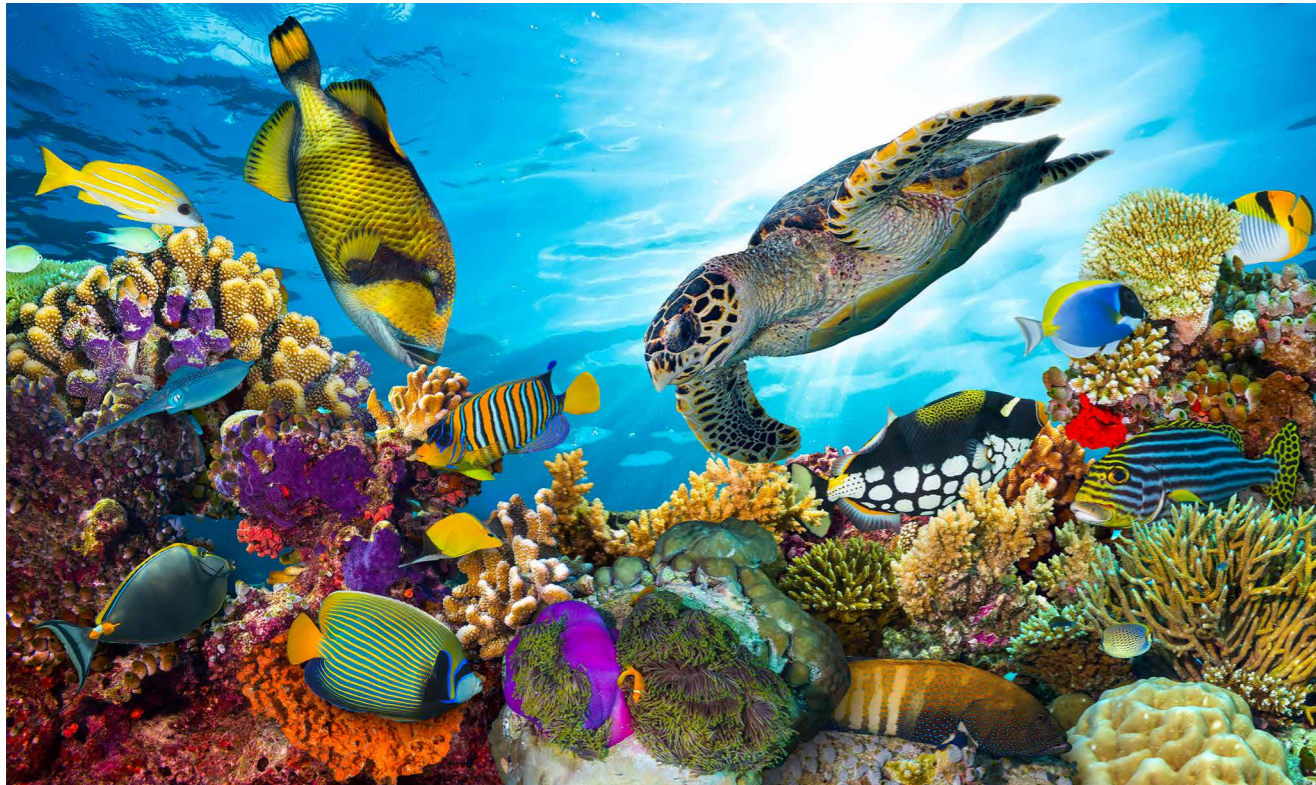
Wollen wir das auf das Spiel setzen? Das Great Barrier Reef vor der Nordostküste Australiens.

Am 8. Juni fand der Welttag der Ozeane statt. Seit 2009 wird dieser von den Vereinten Nationen begangen. Wir wollen daher unsere Aufmerksamkeit auf den Zustand dieser lebenswichtigen Ressource lenken.